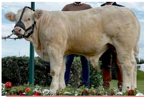
VALOUP. Achat réalisé lors de la vente nationale. 3 e prix d'honneur Montluçon, 1 er national veaux Magny-Cours et Moulins.