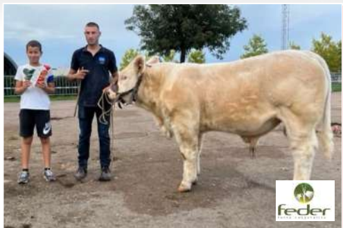
Gaëc de la Bruyère (71) – Concours d'Authun (71).

L'année 2025 a été inédite puisque tous les concours n'ont pas pu tenir en raison du développement de la Dermatose nodulaire contagieuse (DNC) en France depuis le début de l'été. Voici les mâles de l'année récompensés d'un Prix AJEC et le partenaire le sponsorisant. ■