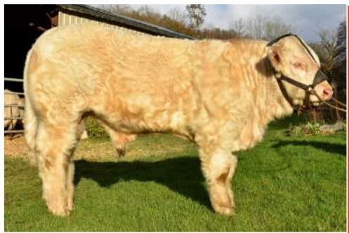
ALTER EGO. Achat réalisé lors de la vente organisée par l'AJEC 42.