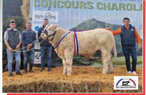
Gaëc Garde Mazet Chaffraix (63) - Charolais prestige (63).