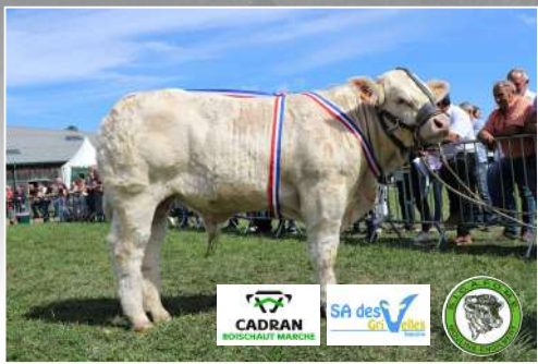
Gaëc Clame-Andriot (03) – Concours national des veaux (58).