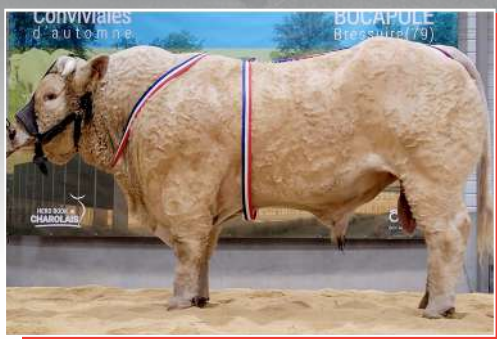
ROMARIN. Achat réalisé à la vente Simon Génétic de l'Ouest. Prix d'honneur sénior Bressuire.

Chaque année, l'AJEC nationale achète un taureau, dont les adhérents peuvent acquérir de la semence pour améliorer la génétique de leur troupeau. Voici les dernières acquisitions. ■