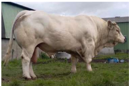
RAVISSANT. Achat réalisé à la vente Simon Génétic de l'Ouest. Prix d'honneur junior La Roche-sur-Yon.