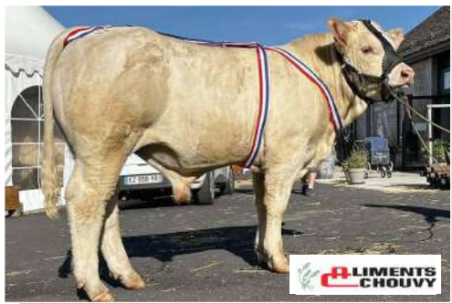
Gaëc Elevage Merle (63) – Concours de Nasbinals (48).