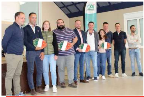
Les lauréats 2024 du trophée AJEC.